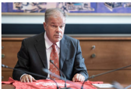
Angelo Tagliabue rettore Università Insubria

In molti si stanno chiedendo se sia possibile fare chiarezza riguardo la possibilità di essere valutati in forma telematica e di conseguenza la possibilità di recuperare le discipline insufficienti al primo quadrimestre. Per questo in molti ritengono che sia necessario fornire ai docenti delle linee guida sulla valutazione per la tutela dei diritti