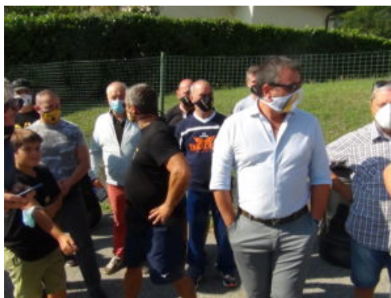
La protesta delle società sportive davanti al Palaghiaccio l'anno scorso

Potremmo portarle le esperienze che viviamo sulla nostra pelle tutti i giorni ma, quando era possibile praticare l'attività a Varese, si respirava un senso di libertà che ripagava i nostri figli di tutti i sacrifici fatti in campo scolastico.