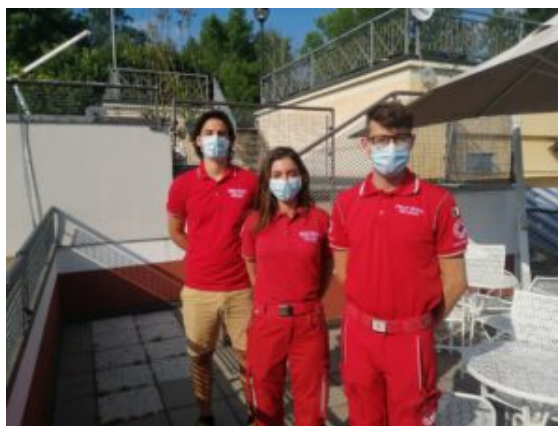
Volontari della CRI Varese

Segnale di presenza significativo che consolida il grande rapporto che da sempre vi é tra il centro città e la Schiranna, luogo tra i piú amati da sempre dai varesini.