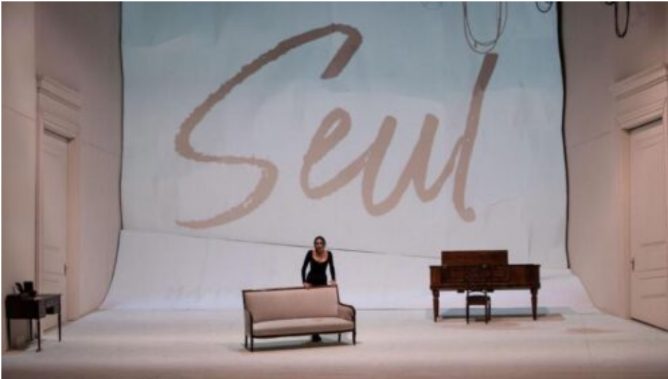
Il 'Werther' di Jules Massenet